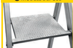
PLATE-FORME DE TRAVAIL ANTIDÉRAPANTE en fonte d'aluminium. Dimensions 250 X 250 mm.

ANTI-SOULÈVEMENT ASSURÉ NATURELLEMENT grâce à la forme de la plate-forme.