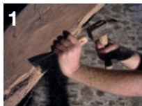
Bûchage des parties attaquées et balayage des poussières

Perçage Ø 9,5 mm tous les 30 cm sur les sections supérieures à 8 cm, (Chevrons, bastinges, madriers...) sur minimum 2/3 de l'épaisseur. Mèche Ø 9,5 mm (réf. 609 001)