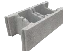
Bloc de 25 angle