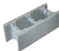
Bloc de 20 angle et coupe