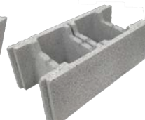
Bloc de 25 coupe